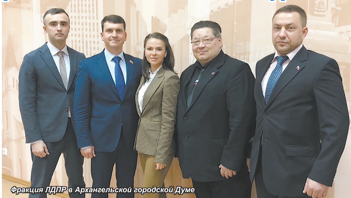
Фракция ЛДПР в Архангельской городской Думе

А ещё ветераны труда ежемесячно получают денежную выплату. Долгое время она была на уровне 456 рублей. Но благодаря инициативе, среди авторов которой были и депутаты фракции ЛДПР в областном Собрании, выплата ветеранам труда возросла почти вдвое. Сегодня она составляет 856 рублей в месяц. Конечно, это не так и много, но всё-таки поддержка. Многие стремятся её получить, но упираются в обязательное требование наличия наград регионального