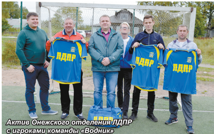
Актив Онежского отделения ЛДПР с игроками команды «Водник»

– Во время летних каникул мы приобрели спортивный инвентарь для детишек посёлков Шаста и Покровское, деревни Кянда, а для школьников луч-